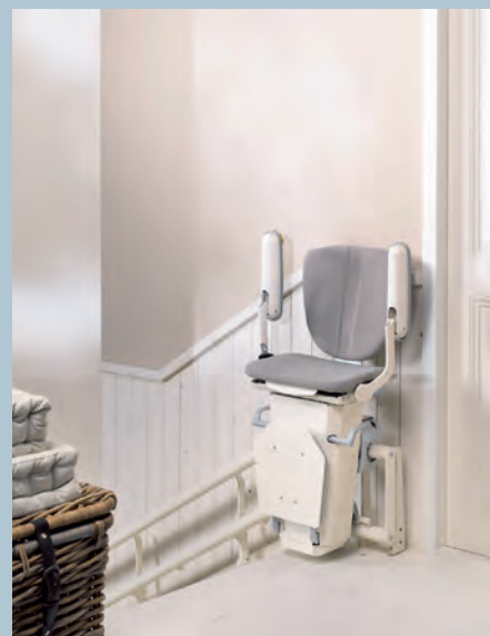
Facilement pliable pour libérer le passage