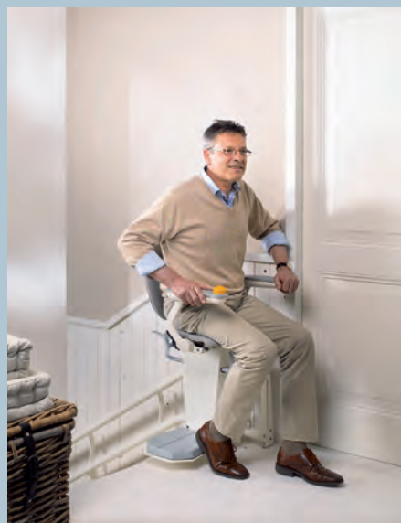
Siège pivotant pour se lever et s'asseoir en toute sécurité