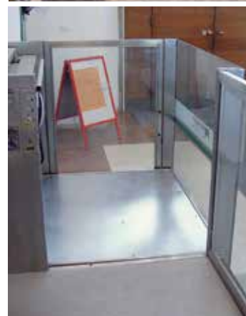
Version avec ferme porte automatique