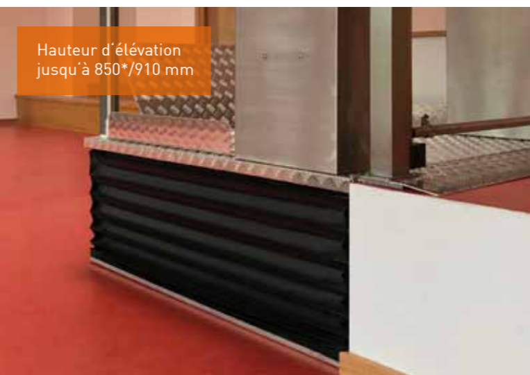
Hauteur d'élévation jusqu'à 850*/910 mm