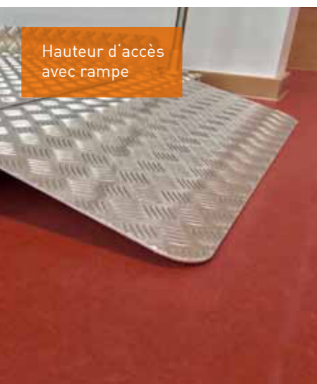
Hauteur d'accès avec rampe