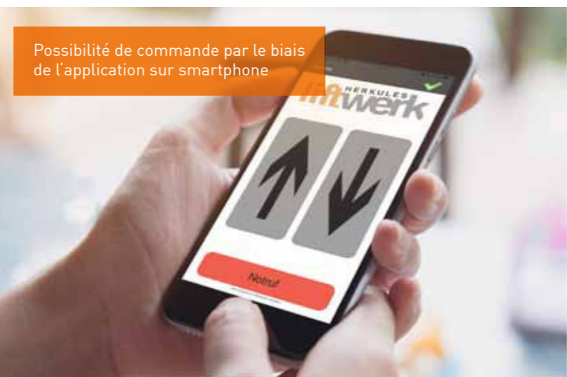
Possibilité de commande par le biais de l'application sur smartphone