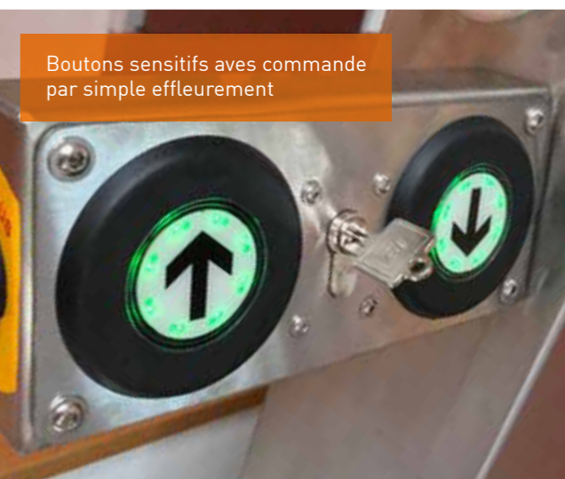
Boutons sensitifs avec commande par simple effleurement