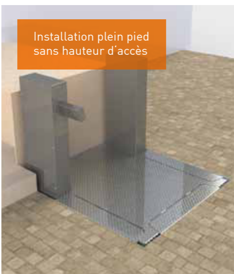
Installation plein pied sans hauteur d'accès