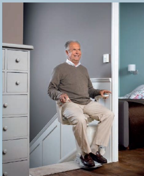
Siège tournant pour agréablement se lever et s'asseoir