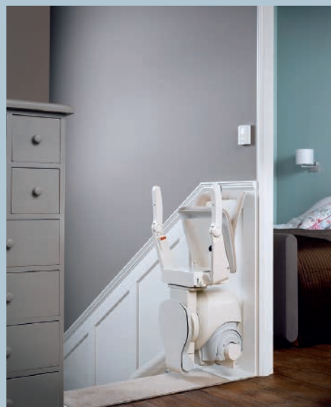
Facilement pliable pour le parcage