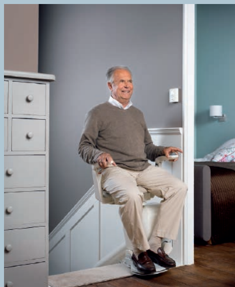
Drehbarer Sitz für das sichere Ein- und Aussteigen