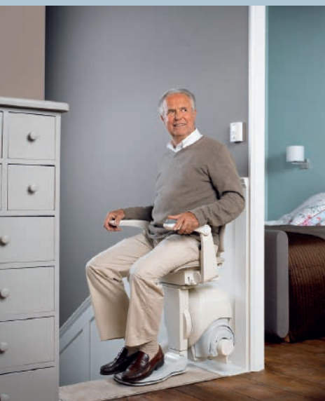
Haltestelle im oberen Stockwerk