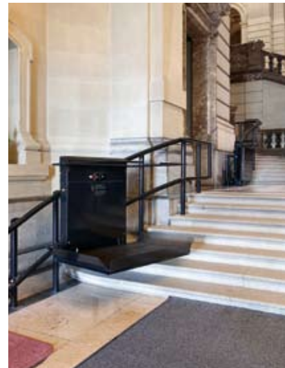
Sonderanfertigung für das Bundeshaus Bern

GTL30 für Treppen mit Kurven, Neigungswechsel und Horizontalfahrt