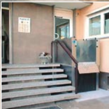
Aufbaubeispiele für den hercules-lift MB 1000.